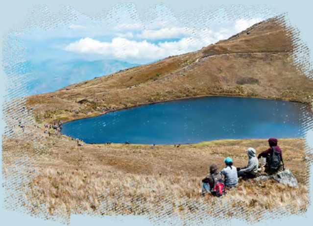
Foto: Laguna Suriwiña, Fierro Urco, Loja